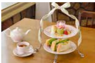
「一色堂茶廊」の箱根スイーツコレクション限定アフタヌーンティー(イメージ)

1914(大正3)年に開園された日本初のフランス式整形庭園。園内カフェ「一色堂茶廊」では、サンドイッチや季節限定のアフタヌーンティーなどが楽しめる。