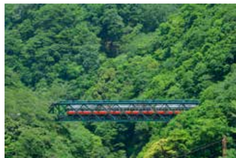
出山の鉄橋として知られる現存最古の鉄道橋で、箱根登山電車の見どころのひとつ(塔ノ沢~大平台間)