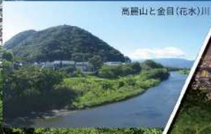
高麗山と金目(花水)川