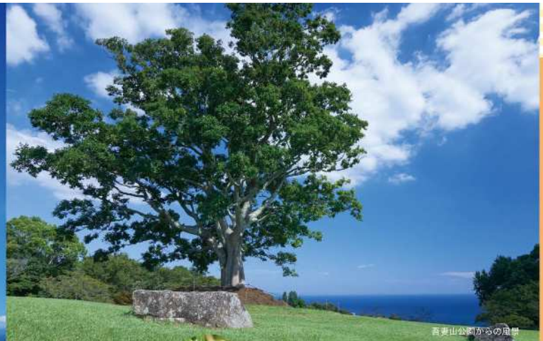
吾妻山公園からの風景

1 高麗山公園 (東青野) 平塚市と大磯町にまたがる標高約180mの山頂からは海側はもちろん、富士山をはじめ近隣の山々が眺望できる人気の公園です。「かながわの花の名所100選」「夜景100選」「平塚八景」など多くの指定を受けています。桜や紅葉が美しく、花見のシーズンには多くの来訪者で賑わいます。 C2 住所：平塚市万田790