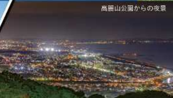
高麗山公園からの夜景