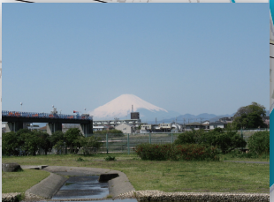
川とのふれあい公園から望む富士