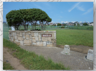
しんけんしほら 信玄芝原公園