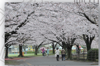
さむかわ中央公園(春の桜)