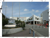
寒川総合図書館 文書館