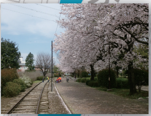
一之宮緑道(春の桜)