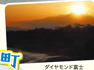
ダイヤモンド富士