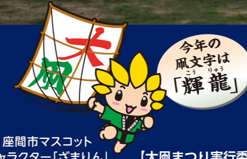
座間市マスコットキャラクター「ざまりん」

【大凧まつり実行委員会事務局 (座間市役所 地域プロモーション課)】 TEL 046 (255) 1111