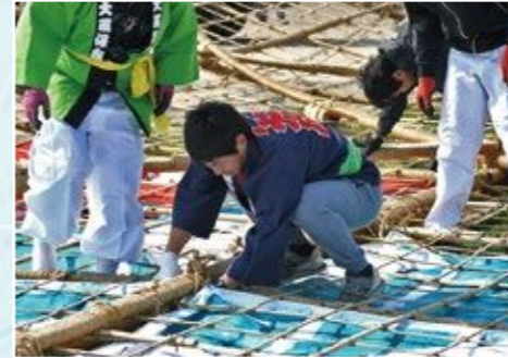
まつり当日。骨組みに紙を貼る様子