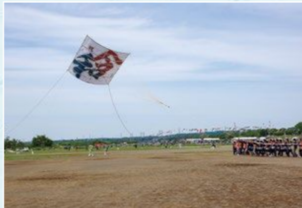
令和元年の大凧揚げ（相模川グラウンド）

昭和57年には、“かながわまつり50選”に選定、平成3年には国の選択無形民俗文化財に指定され、伝統行事・伝統芸能として例年、盛大に開催されています。