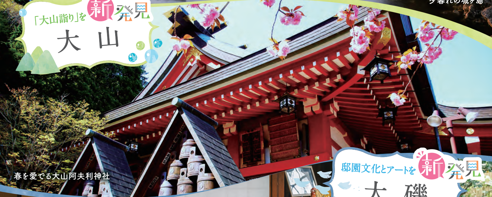
春を愛でる大山阿夫利神社