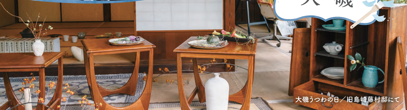
大磯うつわの日／旧島崎藤村邸にて