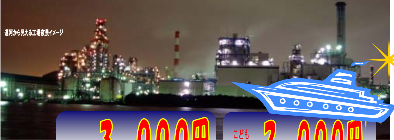
運河から見える工場夜景イメージ